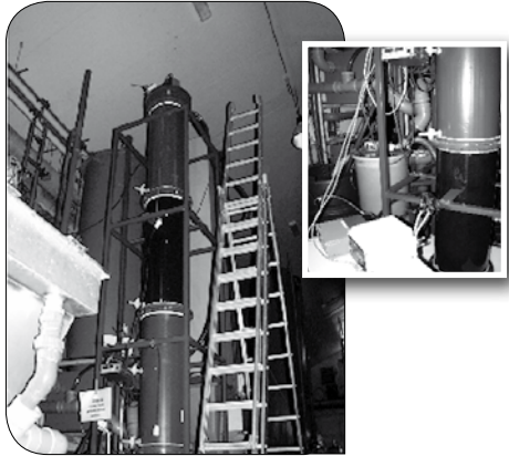
Figuur 3. Een up flow sludge blanket denitrificatie reactor, op de achtergrond het trickling filter voor de nitrificatie.

Dus in recirculatiesystemen zal door nitrificatie de pH dalen, wat gecorrigeerd kan worden door zout (bijv. natriumbicarbonaat) toe te voegen. De kweker kan zelf beslissen hoe laag hij de pH laat zakken. Net zoals bij het ammonium-ammoniak evenwicht, beïnvloedt de pH alle andere evenwichten tussen de vele aanwezige stoffen in het recirculatiewater. In de natuur is een lage pH niet ongewoon. Bijvoorbeeld in het Amazonebekken overstroomt de dicht begroeide uiterwaarden jaarlijks, en vindt er daarom veel biologische afbraak plaats waardoor de pH zakt. Bovendien heeft de bodem er een hoge zuurgraad. Een pH in het water van tussen de 4 en 5 is er heel gewoon. Een pH tussen de 3 en 4 is zelfs niet uitzonderlijk. Toch passen de lokale visgemeenschappen zich elk jaar opnieuw aan deze omstandigheden aan. Stabiele lage pH's kunnen we ook in intensieve recirculatiesystemen aanhouden. Echter, dan is