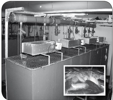
Figuur 2. Experimenteel systeem met meerval (volgens schema in figuur 1) voor de kweek van meerval uitgevoerd met een nitrificatie en een denitrificatie reactor. Water verversing ongeveer 25 liter per kg voer.

De oplossing hiervoor is het nitraat ( NO_3^- ) om te zetten tot stikstofgas ( N_2 ) via het