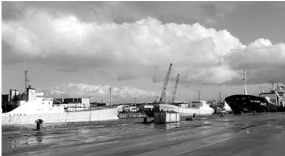
Enkele grote trawlers in de haven van IJmuiden.

Handelsnatie Nederland is in de vishandel in het algemeen, maar ook bijvoorbeeld in de siervishandel, een belangrijke speler. In de hitparade van visexporterende landen staat Nederland op de 8 e plaats. De waarde van de geëxporteerde vis bedroeg in 2003 bijna € 2,2 miljard. De waarde van de geïmporteerde vis bedroeg dat jaar € 1,7 miljard, waarmee ons land op de 12 e plaats stond