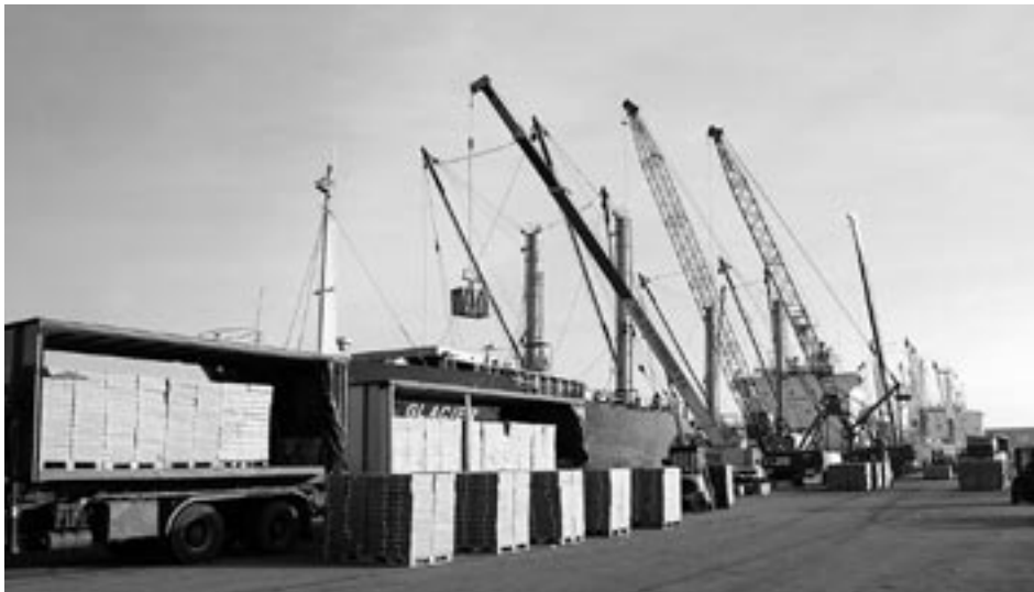
Kartonnen pakken met diepgevroren vis worden in IJmuiden in een vrachtboot geladen.

Met dank aan G. van der Bent voor enkele van de foto's.