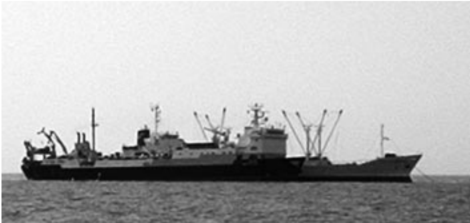
Nederlandse vriestrawler (links) laadt in Mauritaanse wateren vis over op vrachtboot.

van visimporterende landen. Bij zo'n plaats in het klassement past de naam "Klein Duimpje" echt niet meer. Het aandeel van de gekweekte producten is hierin nog niet groot, en komt bovendien grotendeels op rekening van de naar België en Frankrijk geëxporteerde mossels en oesters.