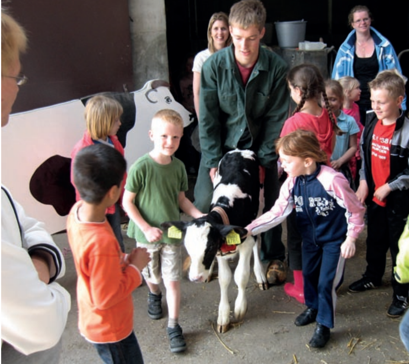
Groep 3 van de Paulusschool Giesbeek op stap met de kalfjes

Kamp is dat voor een belangrijk deel vanwege de ontwikkelingen in de agrarische sector. Die hebben ertoe geleid dat boeren keuzes moesten maken in de bedrijfsvoering: stoppen, omschakelen, schaalvergroten of marktgeoriënteerd verbreden. “Boeren op zoek naar verbreding wilden erkenning voor deze neventak.”