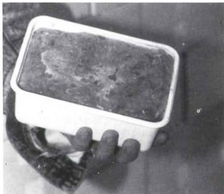
Het kuit wordt in 1 kilo-dosjes gevoren.

Over het algemeen worden drie soorten viskuit door de handel aangeboden, te weten, haringkuit, scholkuit en kabeljauwkuit. Het afgelopen jaar heeft Dolf verschillende proeven