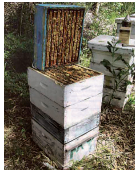
Gekantelde bovenbak voor controle op zwermcellen.