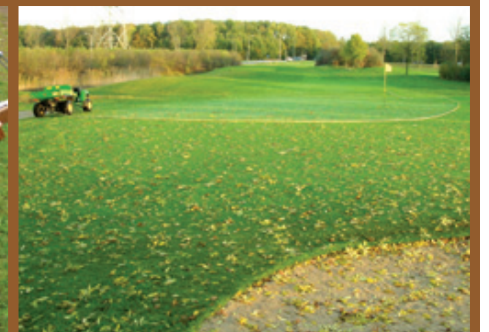
Een voertuig rijdt buiten de green of apron en maakt in dezelfde rondgang green, foregreen en een stuk fairway dauwvrij met een sweeplang. Zo ontstaat een buffer met minder actieve schimmels. Tijdwinst en een groter dauwvrij speloppervlak maken dit instrument succesvol.

vegen. Deze is geduwd of getrokken over de green te lopen. Nadeel is dat bij sterke glooiing soms een extra rondgang moet worden gemaakt.