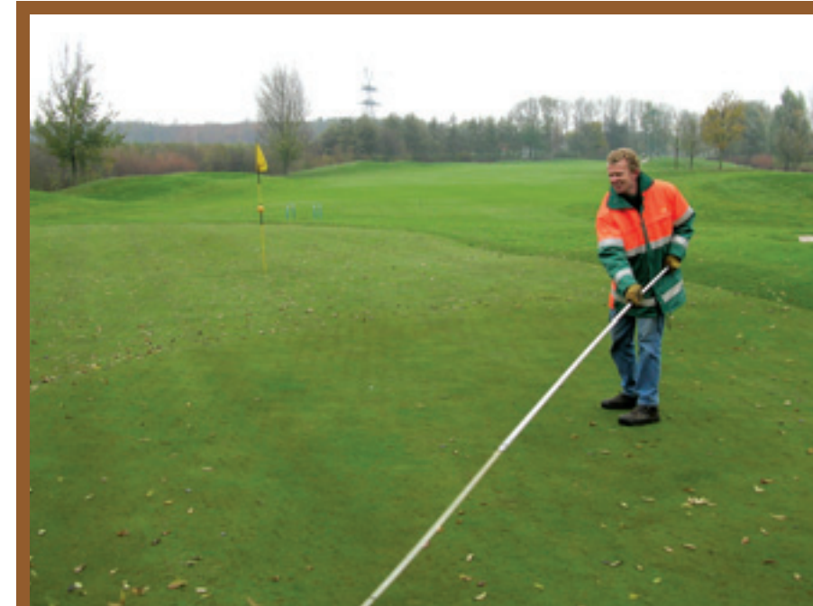
De sweepstok is vermoeiend voor knieën, onderrug en schouders en tijdrovend in uitvoer.

Door middel van een getrokken bezem achter een licht transportvoertuig, variërend van 1,5 tot 2 meter breed zijn dauwdruppeltjes tot grote druppels te vegen. Nadeel hierbij is dat het voertuig op de green komt en de bezem volgt glooiing soms niet. Met een soort 'tochtstrip' aan een steel van 2,5 meter breed zijn ook dauwdruppels tot grote druppels te