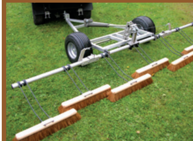
De bezem moet met een voertuig over de green rijden waardoor verdichtingsproblemen kunnen ontstaan.