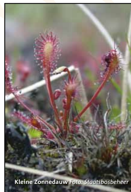
Kleine Zonnedauw

De opslag van de data wordt ontwikkeld in nauwe samenwerking met het Instituut voor Biodiversiteit en Ecosysteem Dynamica van de Universiteit van Amsterdam. Gezien het onafhankelijke karakter van de GAN zal de databank, nadat deze is opgezet met geld van het ministerie, zichzelf in de markt moeten bewijzen. “Winst hoeft er niet te worden gemaakt, maar de exploitatie zal kostendekkend moeten zijn. Er zal dus een redelijk abonnementstarief gaan gelden”, aldus Borgeld.