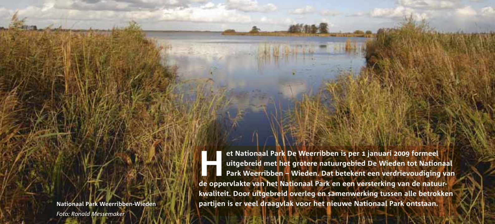
Nationaal Park Weerribben-Wieden

H et Nationaal Park De Weerribben is per 1 januari 2009 formeel uitgebreid met het grotere natuurgebied De Wieden tot Nationaal Park Weerribben – Wieden. Dat betekent een verdrievoudiging van de oppervlakte van het Nationaal Park en een versterking van de natuurkwaliteit. Door uitgebreid overleg en samenwerking tussen alle betrokken partijen is er veel draagvlak voor het nieuwe Nationaal Park ontstaan.