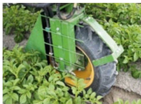
▲ De wielkappen zorgen voor een goede geleiding van het loof langs de wielen.