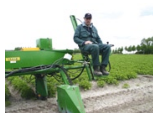
▲ De zittingen kun je hydraulisch omhoog- en omlaagschuiven.