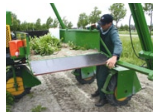
▲ Door een van de kleppen aan de zijkant te openen, kun je de voorraadbak leegschuiven.