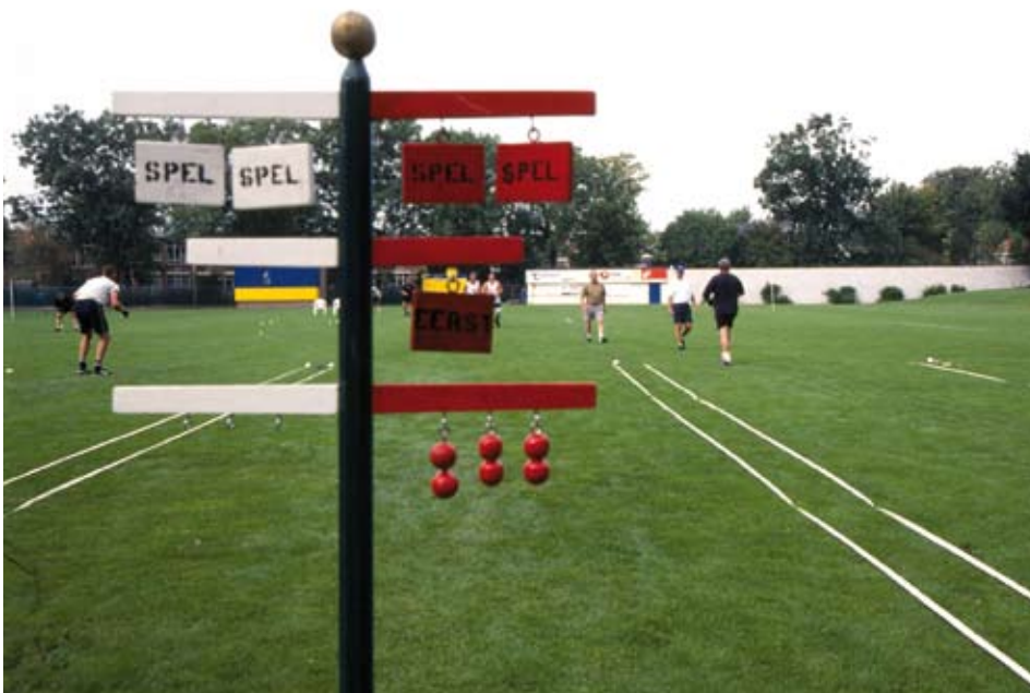
De telegraaf, het traditioneel scorebord.

“Een perfecte groene grasmat, waar de parturen goed op kunnen kaatsen”