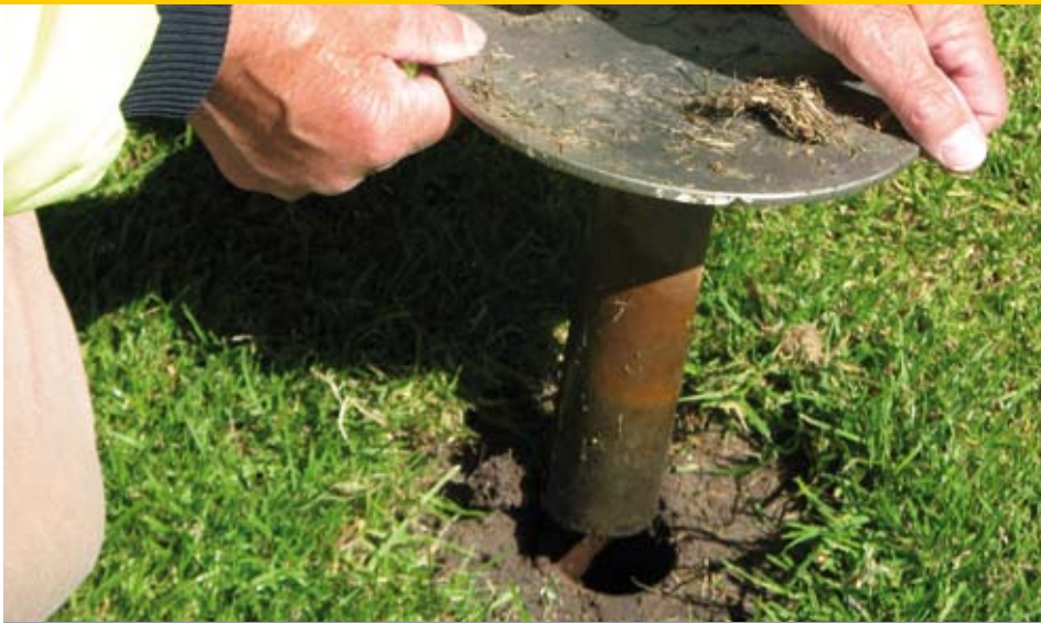
Jan Oostra toont de plek waar de kweapealen (kwaadpalen, hoekpalen) komen te staan.

kent ook nadelen. De laatste jaren hebben we in de periode juli/augustus veel regenwater gehad. En dat is dan uiterst vervelend om dat er juist in die periode veel gekaatst wordt. Hoosbuien zijn lastig te verwerken. Kaatsvelden liggen dus daarom redelijk bol, dat speelt in combinatie met greppels ook een belangrijke rol bij de afvoer van regenwater. Drainage in de kleigronden op zo'n kaatsveld is geen vanzelfsprekendheid: vaak