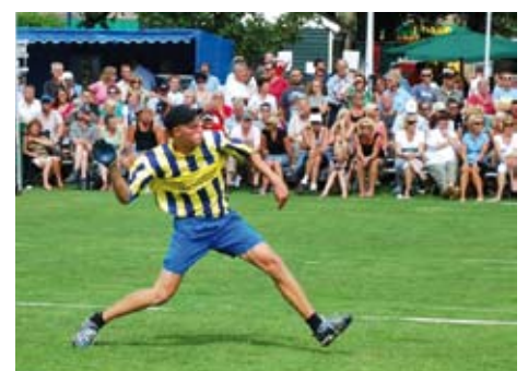
Kaatser in actie