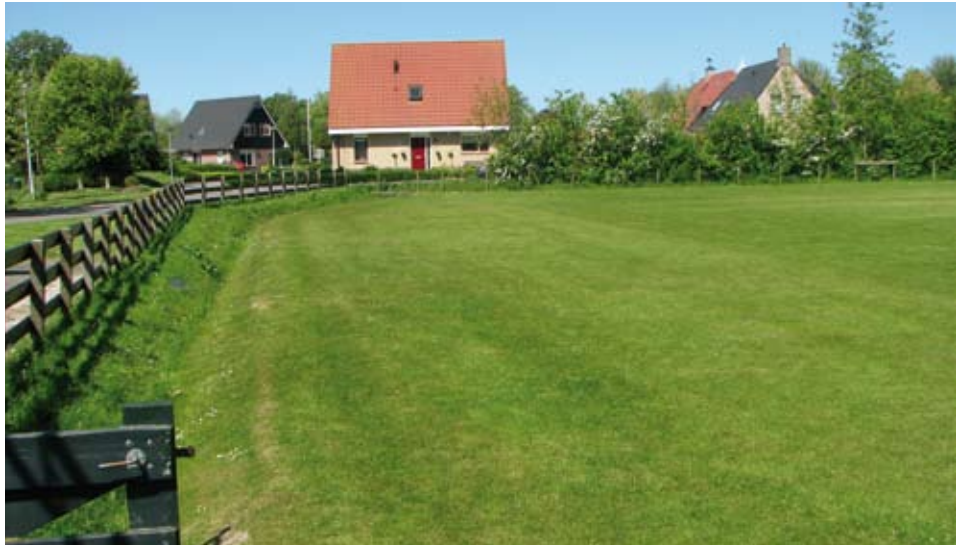
Kaatsveld met greppels in het dorpje Hitzum.