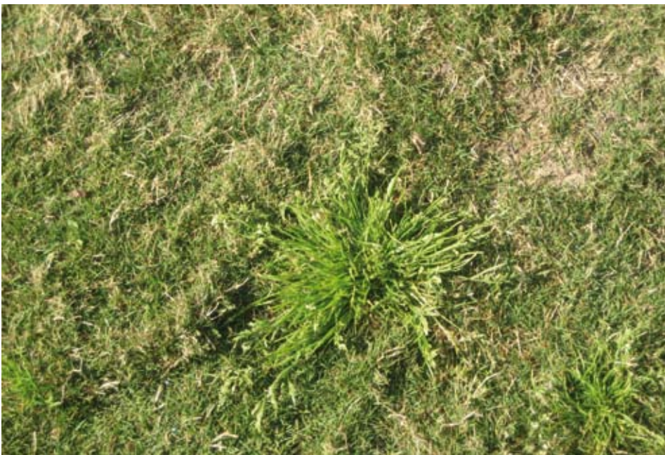
Een echte polvormer.

Straatgras verdraagt regelmatig, niet te kort maaien (minimale hoogte 0,5-2,5 cm). Het gras laat zich niet eenvoudig knippen; het blad is immers uiterst slap vanwege het ontbreken van ribben. Straatgras is een grassoort die zich vrij