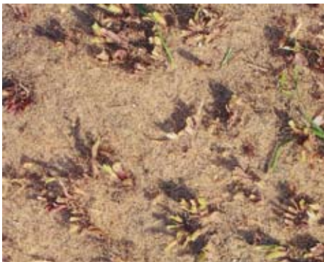
Bewerking met Field Topmaker: het straatgras verdwijnt, de groeipunten van Engels raaigras zijn er nog.

eenvoudig aan het maaieregime aanpast. Wanneer we korter gaan maaien, wordt de afstand tussen de knopen korter en kan de gedrongen plant zelfs onder de maaisnede zaad vormen. Onder groeizame omstandigheden kan straatgras een behoorlijke hoeveelheid vilt vormen. Door tijdig te wieden blijven we dit de baas. Voor een strak maaibeeld maaien we een stadionveld twee keer in een verschillende richting. Tussen de twee maaibeurten door bewerken we het veld met een wiedeeg om het kruipende straatgras uit de zode te verwijderen.