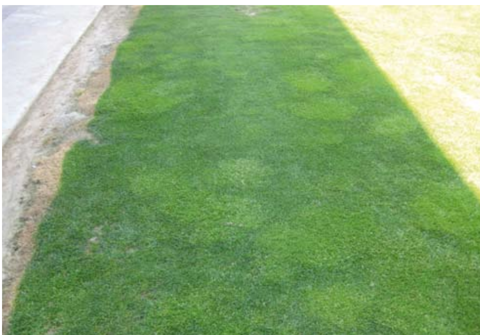
Straatgrasvlekken in een Spaanse grasmat

Straatgras ( Poa annua ) verdraagt betreding matig tot slecht en is zeer vorst- en droogtegevoelig. Dat maakt dit grassoort ongeschikt als basis voor een sportveld. Bovendien heeft een grasmat met straatgras een zeer slechte optische kwaliteit. Bij een matige voedingstoestand verkleurt het grassoort van nature van middengroen naar lichtgroen. Ook onder droge omstandigheden toont Poa annua direct zijn lagere vitaliteit. Straatgras kleurt wanneer de vochttoestand in de toplaag te laag is direct naar lichtgroen en gaat vervolgens weelderig bloeien. Naast bovengenoemde ongunstige eigenschappen is straatgras een zeer geschikt opvulgras. Wanneer terreingedeelten door intensieve betreding kaal zijn gespeeld, 'kleurt' straatgras, dat al bij 5 graden Celsius in twee tot vier dagen kiemt, de kale stukken uiterst snel groen. Dit is natuurlijk geen duurzame oplossing, maar op stadionvelden altijd nog beter dan kale oppervlakken.