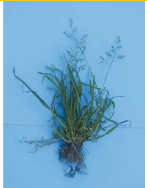
De bloeiwijze en de ondiepe beworteling van straatgras.