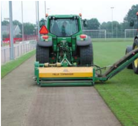
Field Topmaker aan het werk