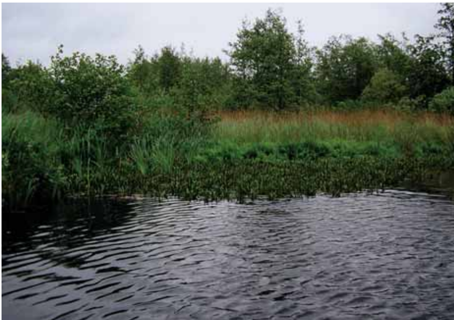
Verlandingsvegetatie in de Molenpolder. Waterscheerling en waterdrieblad zijn duidelijk herkenbaar.

Toepassing van de Kaderrichtlijn Water en de normen conform Natura 2000 vragen om een evaluatie van de effectiviteit. De KRW blijkt een correct middel om maatregelen te nemen, maar in de hoogste klasse is het onderscheid (te) gering. Worden de doelen van de Natura 2000-habitats 'evenwichtige laagveensystemen met daarmee verbonden laagveenverlandings' ook gehaald? Onderzoek van waterplanten in twee Natura 2000-habitats, namelijk laagveenplassen en -sloten, toont duidelijk aan dat essentiële schakels in de systemen niet meer voldoende aanwezig zijn. De waarnemingen bestaan vrijwel geheel uit losse individuele planten, indien al aanwezig. Losse krabbenscheerplanten in een zee grof hoornblad vormen geen eindstadium van verlanding in veenplassen zoals de criteria voor Natura 2000 aangeven.