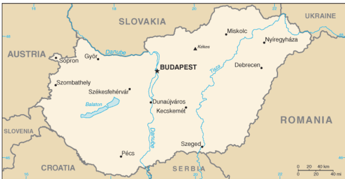
(CIA World Factbook)

Kansen en mogelijkheden in de Hongaarse tuinbouwsector