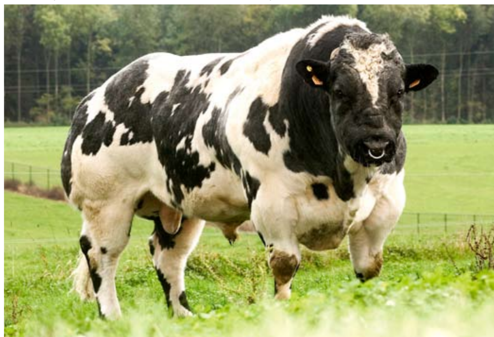
Gitan, onopvallende recordhouder als eerste over de kaap van 100.000 doses

Eén standaardafwijking is gelijk aan 10 punten. Bron: Herdbook BBB, Ciney december 2008