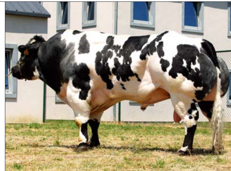
GITAN DU P'TIT MAYEUR (CUBITUS X TORRERO)

Vestigde de stier Seducant de Foz de aandacht van de veehouders op het aspect economie, Gitan zal met zijn hoogtemaat van 160 centimeter de boeken ingaan als verbeteraar van het gebrek aan maat in het ras. |