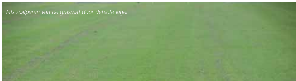
lets scalperen van de grasmat door defecte lager