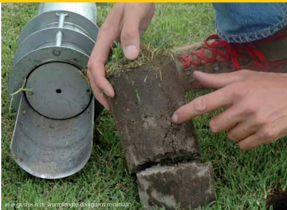
In augustus is de wortellengte doorgaans minimaal

openbaar groen en grijs (de buitenruimte) bezig zijn. Hun takenpakket is heel breed: sportvelden, begraafplaatsen, openbaar groen, maar ook eenvoudige wegebouw klussen. In die club is Soppe min of meer de gangmaker op het gebied van sportvelden. Hij heeft in 2003 een opleiding tot terreinmeester gevolgd en is daarna meer en meer enthousiast geraakt over het onderhoud van voetbalvelden. En dat terwijl hij met voetbal zelf helemaal niets heeft. Soppe: "Het gesprek over Ajax en Feyenoord op maandagochtend in de kantine gaat helemaal langs me heen."