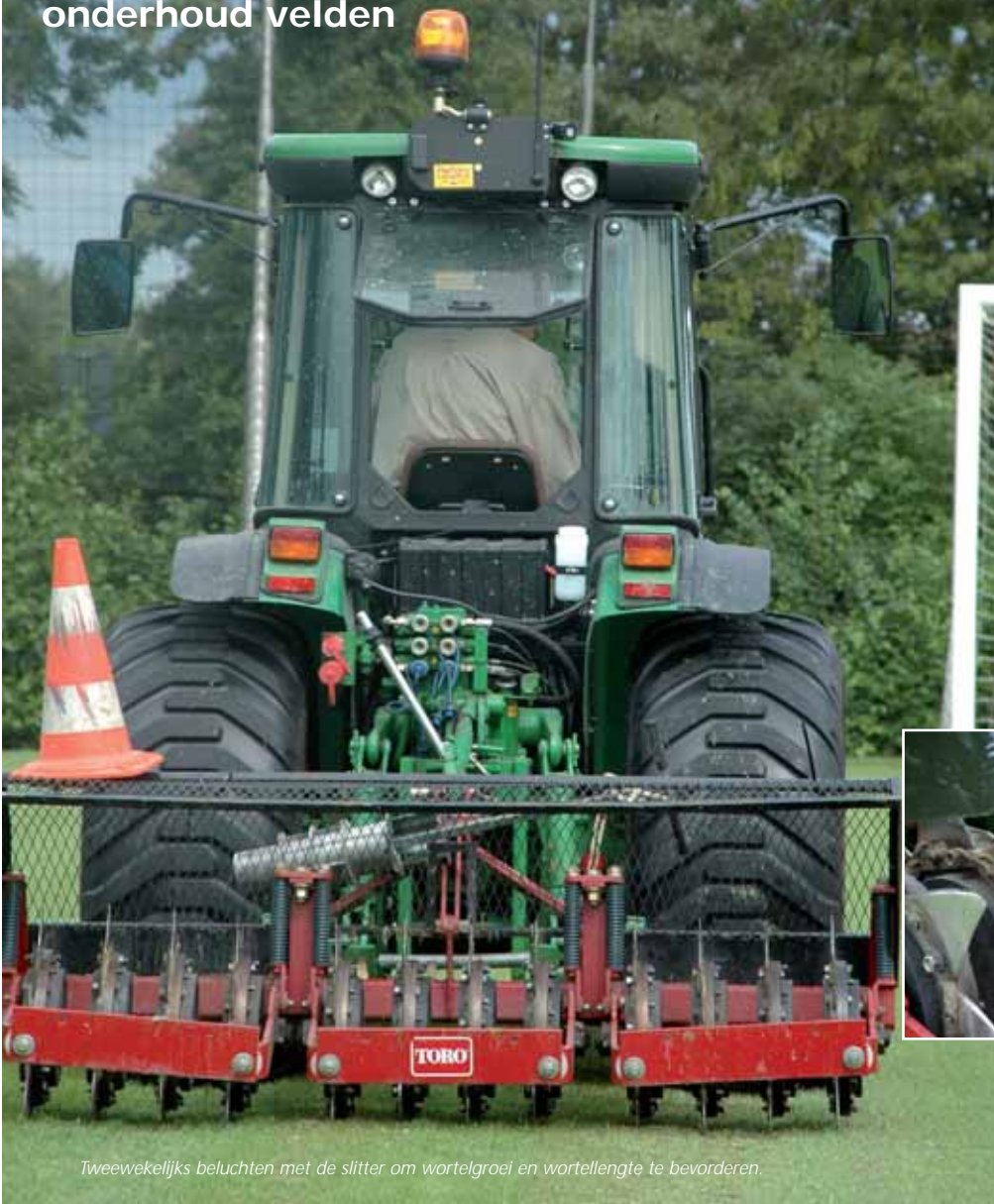
Tweewekelijks beluchten met de slitter om wortelgroei en wortellengte te bevorderen.

Rien Soppe vertrouwt op vrijwilligers bij onderhoud velden