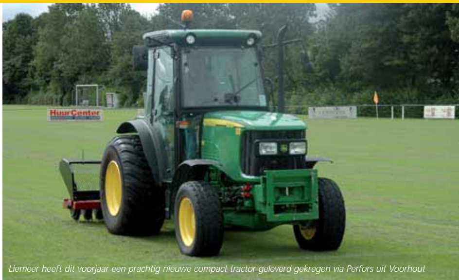
Liemeer heeft dit voorjaar een prachtig nieuwe compact tractor geleverd gekregen via Perfors uit Voorhout

"In andere jaren liggen de sproeiers misschien ook niet 100% optimaal, maar dat valt dan niet op, omdat er toch wel een keer een buitje tussendoor valt. Dit jaar kregen we niets en dan wordt iedere fout direct afgestraft."