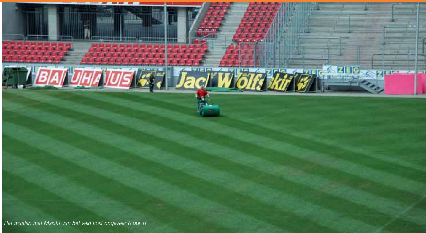
Het maaien met Mastiff van het veld kost ongeveer 6 uur !!