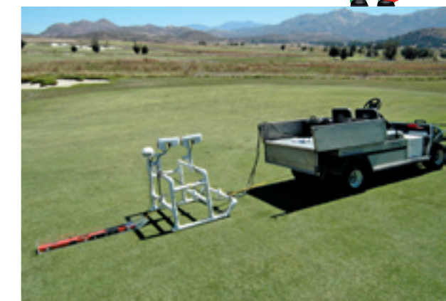
Pace Turf in San Diego, Californië, heeft op verschillende golfbanen de NDVI gemeten. Hier zijn de sensoren gemonteerd op een slee die over de green wordt getrokken.

te lijden heeft onder droogte of te weinig stikstof, dan laten de beelden van de scanner dat al zien voordat het menselijk oog het in de gaten heeft. De scanners meten de reflectie van infrarood en nabij-rood licht en dat is een maat voor de fotosynthese en dus de groei van het gewas. Plus dat de gemeten waarden ook afhankelijk zijn van de mate waarin de grond bedekt is en daardoor ook een maat zijn voor de hoeveelheid plantengroei.