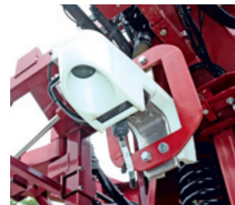
De GreenSeeker sensor ziet er uit als een lamp. Hij straalt licht uit om vervolgens de reflectie daarvan te meten.

Op zich is het een abstract getal waarmee je alleen door het te koppelen aan slimme software vrij nauwkeurig kunt bepalen hoe een gewas erbij staat. In de landbouw lukt dat voor allerlei gewassen steeds beter en doen steeds meer telers er hun voordeel mee door uit de verzamelde gegevens informatie te halen over benodigde bemesting of beregning. De grote kracht van de scanner is de voorspellende waarde. Als op het oog nog niet zichtbaar is dat een gewas bijvoorbeeld