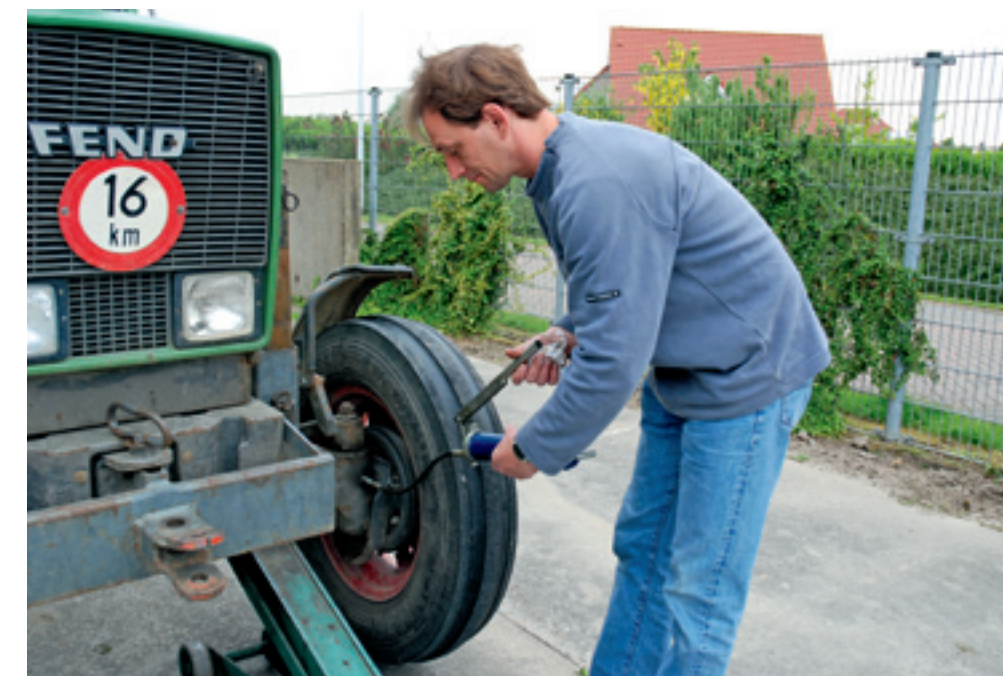
▲ Bij het doorsmeren van trekkers en machines gaat het om het gebruik van het juiste gereedschap, de goede vetsoort en op de aangegeven manier werken. Goed smeren doe je met gevoel.

een kleine hoeveelheid nieuw vet inspuiten. Bij lagers die blootstaan aan veel vervuiling zoals grond, is een hogere frequentie dan voorgeschreven soms noodzakelijk. Zo is bij een trekker met voorlader de belasting van de fusees groter. Dan mag het doorsmeren vaker plaatsvinden. Fusees moet je doorsmeren totdat het vet er langs de lagers weer uitkomt. Dit zijn open lagers en de vetkraag voorkomt dan dat er vuil in het lager kan komen. Tijdens het doorsmeren moet de vooras ontlast worden door een garagekrik onder de vooras te plaatsen en de as op te tillen. Bij een ontlaste vooras komt het vet beter verdeeld op alle plaatsen. Te veel smeren kan ook. Wanneer je bij dichte lagers te veel vet in het lager spuit, gaat deze zwaarder draaien en wordt er meer warmte ontwikkeld. Ook kan de afdichting eruit worden gedrukt wanneer er te veel vet in zit. Hierdoor kan er water en vuil in het lager komen en wordt de levensduur van het lager korter. LM