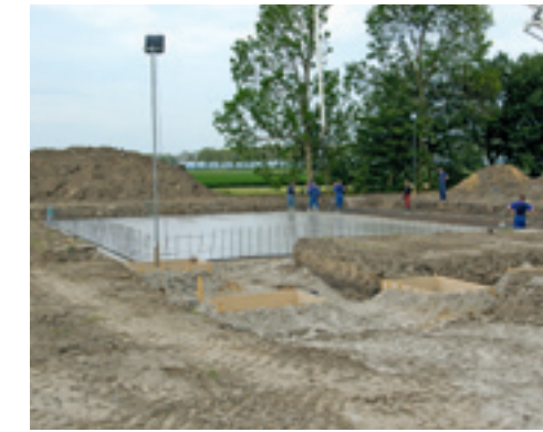
▲ Bij grondverbetering is een roostervloer vaak niet duurder dan bovengrondse kanalen.

Als je bij de investeringskosten alleen naar de prijs per vierkante meter kijkt, is een roostervloer vaak het duurste. Vooral door de ventilatiekelder. Het gaat echter om het gehele gebouw, inclusief de inrichting. Een belangrijke factor is de opslageffectiviteit. Die hangt af van de indeling. Hoeveel paden blijven er over? Hoeveel ruimte nemen de drukkamer en de buitengevels in? Dan blijkt een roostervloer het meest effectief. Ook een kistenbewaring kan heel effectief zijn.