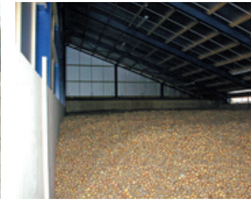
▲ Hoger storten levert niet altijd wat op.