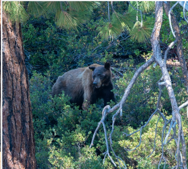
← Bruine beren zijn niet zo gevaarlijk als grizzly's. Deze fotografeerde ik in Yosemite Park – Californië.