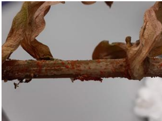
Figuur 3. Rode speldeknoopgrootte vruchtlichaampjes met sporen van Fusarium solani op de stengel van een aangetaste plant. Opbouwende waterdruk in de vruchtlichaampjes lanceert de ascosporen tot meters ver de lucht in.

Net als F. oxysporum verspreidt F. solani zich veel via plantmateriaal, grond en water. Maar F. solani is daarnaast ook een seksueel voortplantende schimmel, die ook zonder partner vruchtlichaampjes met sporen kan vormen. Deze vruchtlichaampjes zijn rood en één tot enkele millimeters groot en kunnen met het blote oog waargenomen worden op stengels en andere plantendelen (Figuur 3). De waterdruk die opbouwt in de vruchtlichaampjes helpt om de gevormde sporen meters ver de lucht in te slingeren.