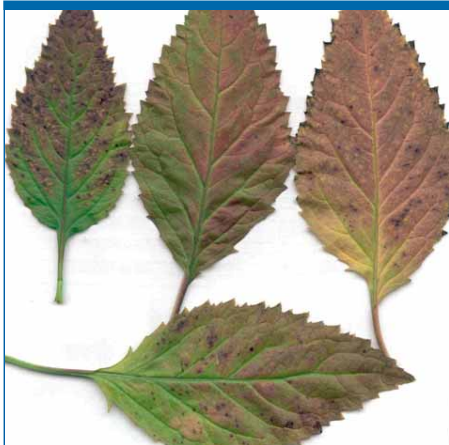
Bij trachelium komen bij mangaanovermaat bruine stippen en vlekken voor en treedt ook roodverkleuring op.