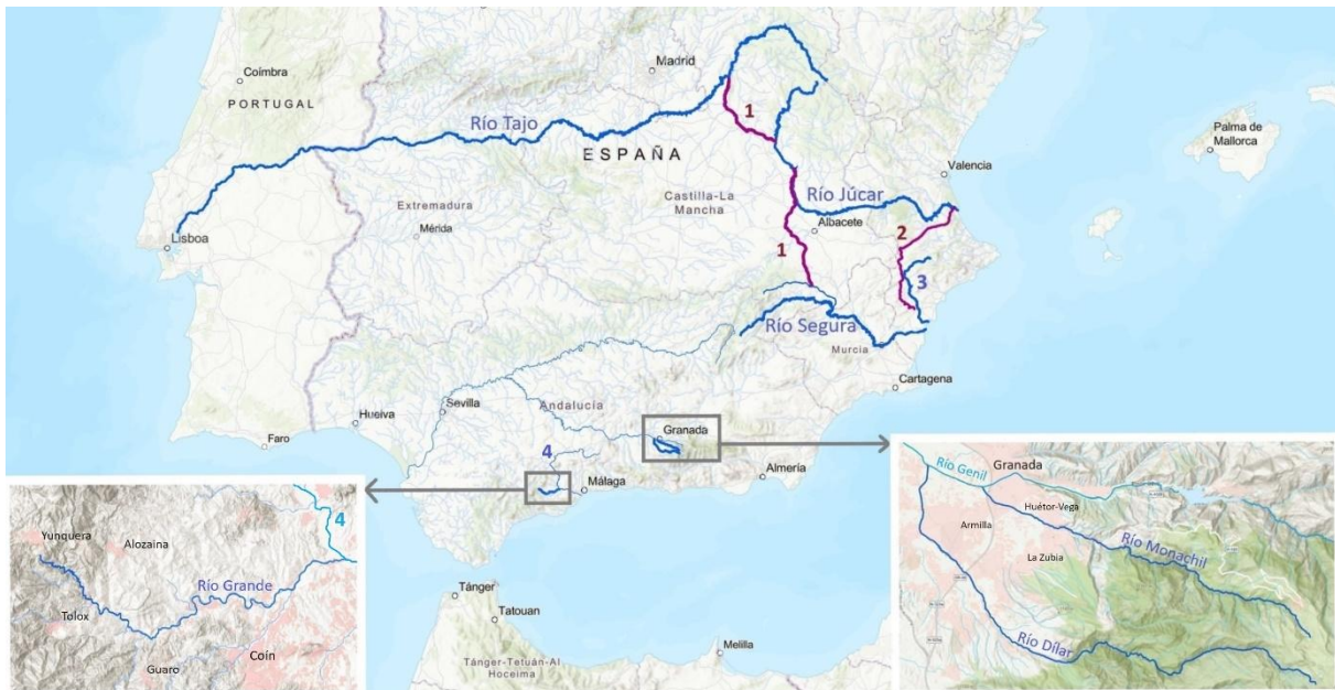
Figura 2. El trabajo aborda cuatro casos de estudio: El trasvase Tajo-Segura (1); el río Júcar; el río Grande (abajo a la izquierda); y los ríos Dilar y Monachil (abajo a la derecha). El mapa reproduce también la traza del trasvase Júcar-Vinalopó (2), el curso del río Vinalopó (3) y el del río Guadalquivir (4), donde desemboca el citado río Grande.