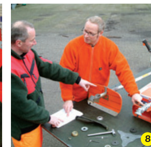
8 In een bosmaaiertraining leer je o.a. het shreddermes en de bijbehorende beschermkap goed te monteren.