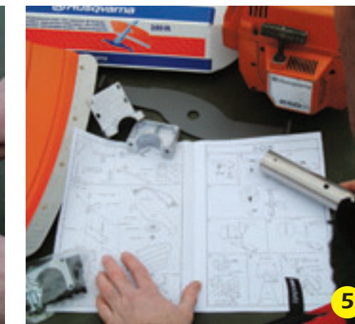
5 Montagetekening: Zo wordt het shreddermes veilig gemonteerd, met de juiste beschermkap.