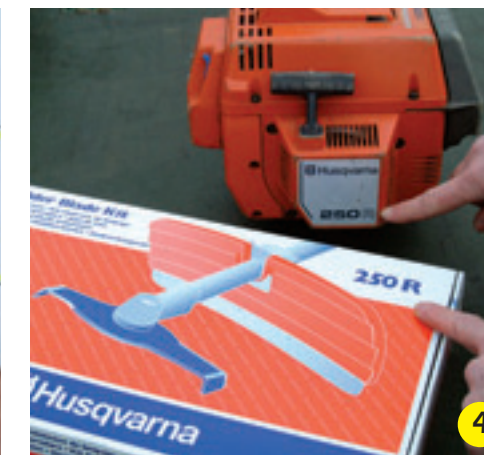
4 Op de verpakking staat dat dit shreddermes alleen op de 250R bosmaaier gemonteerd mag worden.