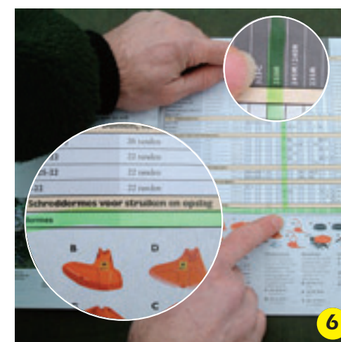
6 Catalogus: De goedgekeurde combinaties van alle typen bosmaaiers en goedgekeurde accessoires. Het shreddermes mag dus alleen op de 250R gemonteerd worden.

Trainingsbureau Fiedeldij Dop & Tuinte verzorgt o.a. bosmaaiertrainingen op maat om de werknemers in hun eigen bedrijfs situatie praktisch op te leiden. Meer info op www.degroenepraktijk.nl en via telefoon (026) 482 17 79 of 06 51 126 942. Met dank aan Wassingmaat B.V. te Renkum.