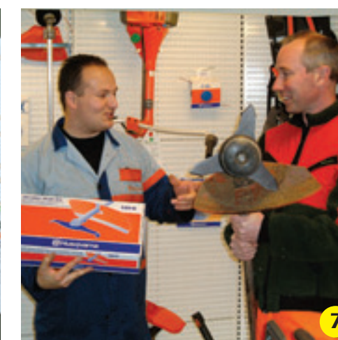
7 Voor het maaien van bramen adviseert de dealer het shreddermes. Hij legt uit dat deze alleen op deze bosmaaier, type 250R, gemonteerd mag worden en dan alleen in combinatie met de speciale beschermkap.