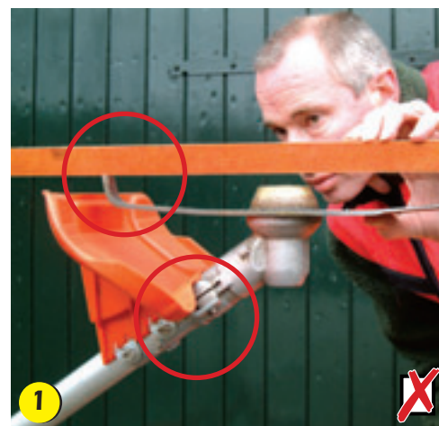
1 Verkeerde beschermkap, geen overlap met het maaivlak: levensgevaarlijk!

De beschermkap moet in ieder geval het maaivlak overlappen. "Dit is eenvoudig te controleren door een lat over het shreddermes te leggen", zegt Mark Hulleger, bosmaaier-instructeur bij Fiedeldij Dop & Tuinte. Bij afbeelding 1 is het shreddermes in plaats van het slagmes gemonteerd op een bosmaaier type 345 R. Wegspattende vuil, zoals stenen en glas, kan dan rechtstreeks via de onder- en bovenkant van de – verkeerde – beschermkap de bedieningsman met circa 400 km/h raken! De fabrikant heeft een speciale beschermkap voor het shreddermes (afbeelding 2) voor bosmaaier type 250 R ontwikkeld. Deze overlapt het maaivlak. Bovendien wordt nu de bovenkant beter afgeschermd. Wegspattend vuil raakt via de grond snelheid kwijt voordat het de bedieningsman raakt.