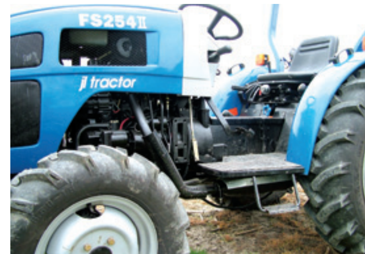
De instap is ruim. De uitlaat loopt naar onderen weg onder de bestuurder door.