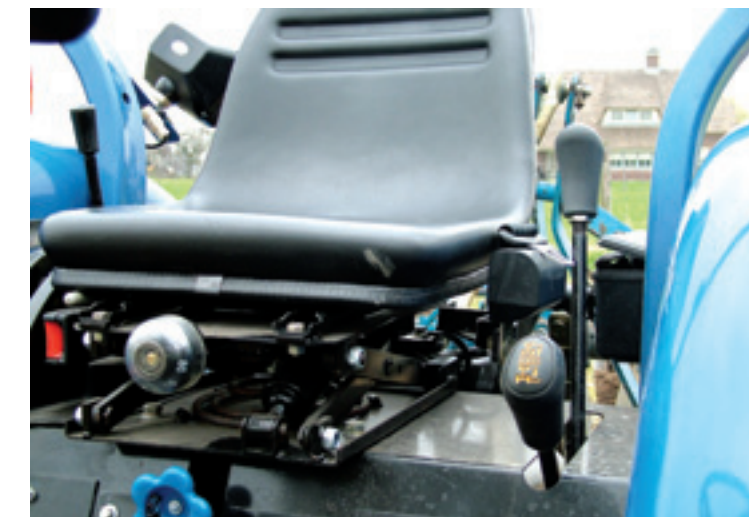
De stoel, met veiligheidsgordel, is verstelbaar en ook instelbaar op bestuurgewicht. Met de grote blauwe draaiknop onder de stoel is de hydraulische hefsnelheid in te stellen.