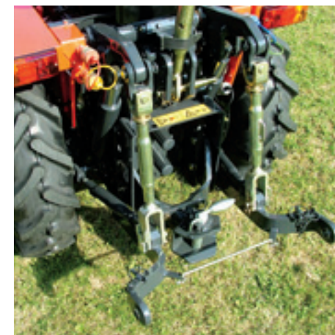
De hef tilt met 1.900 kg meer dan het eigen gewicht van de trekker. De hefarmen zijn overigens bijzonder vast te zetten.

Het eerste wat opvalt als je opstapt, is dat er meer ruimte is. De Tigrone is dan ook tien centimeter groter dan de oude serie. Dit was nodig omdat de mens groter is geworden. Bij de oude serie zat je nogal krap. De stoel zat te dicht op de poken en de pedalen intrappen was een ramp. Alhoewel er bij de Tigrone nu meer ruimte, is het nog oppassen bij het intrappen van de pedalen met grote werkschoenen. Wanneer je niet met de tenen op de pedalen staat, raak je al snel de afscherming, die overigens verplicht is bij een knikstuur, waardoor je het koppelingspedaal en de rempedaal niet volledig kunt intrappen. Jean Heybroek vervangt dan ook de stalen afscherming door een rubberen waardoor je het pedaal wel altijd volledig kunt intrappen. Bij de grotere SN en SX is er overigens standaard meer ruimte. Naast meer ruimte is de Tigrone ook ergonomischer. De trekker heeft een geveerde bestuurdersplatform en de stoel is gemakkelijk verstelbaar. Standaard is hydraulische stuurbevestiging. Handig detail is een 12 Volt aansluiting voor bijvoorbeeld een elektrisch spuitje. Verder is er een verstelbare trekhaak en een opklapbare rolbeugel.