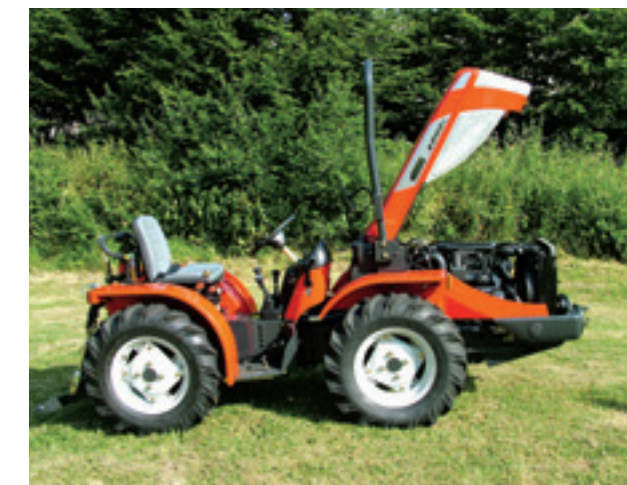
De motorkap gaat nu van voren omhoog in plaats van dat je de kap naar voren moest openklappen bij de oude serie. Hierdoor kunnen frontgewichten en trekhaak blijven hangen.