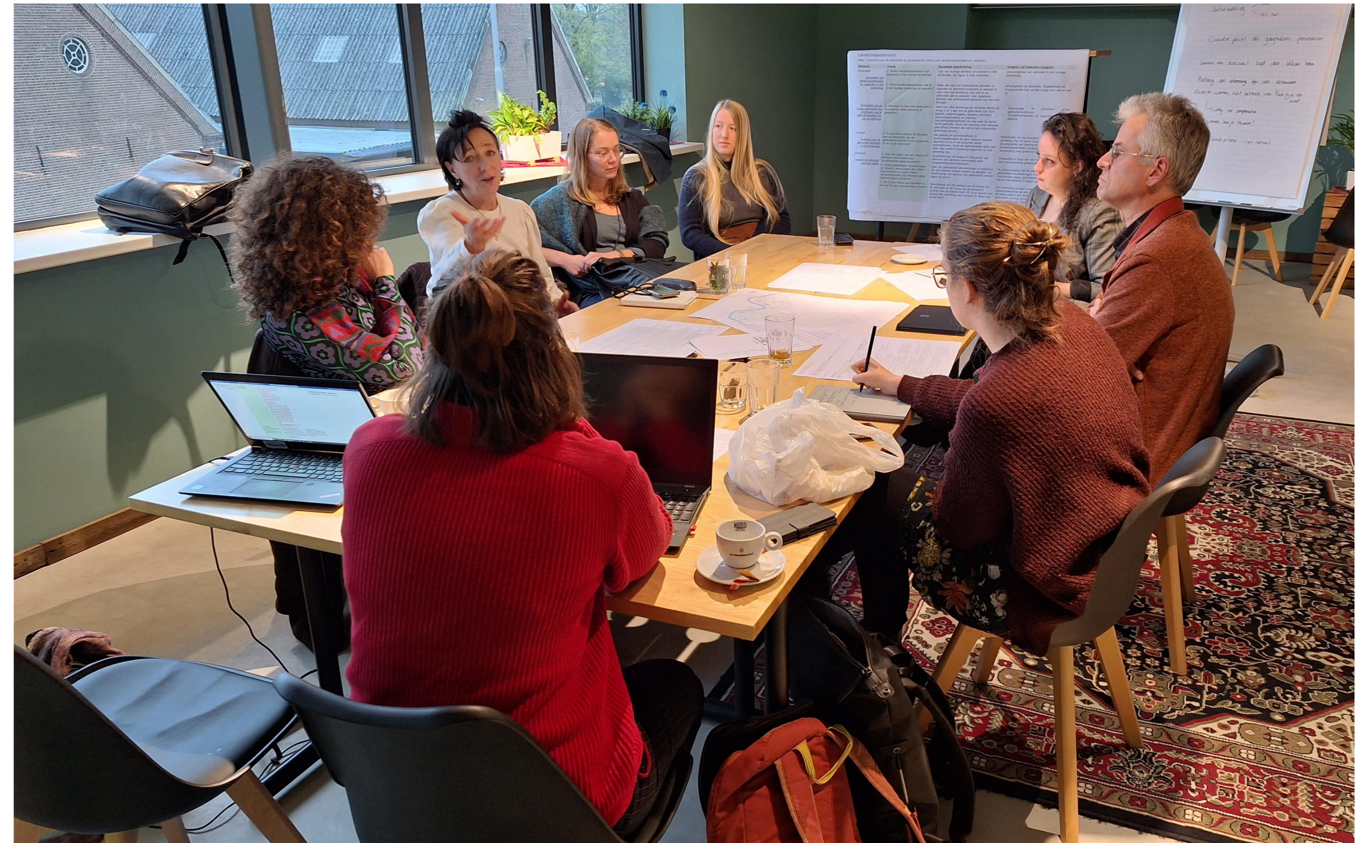
Figuur 2. Workshop setting.