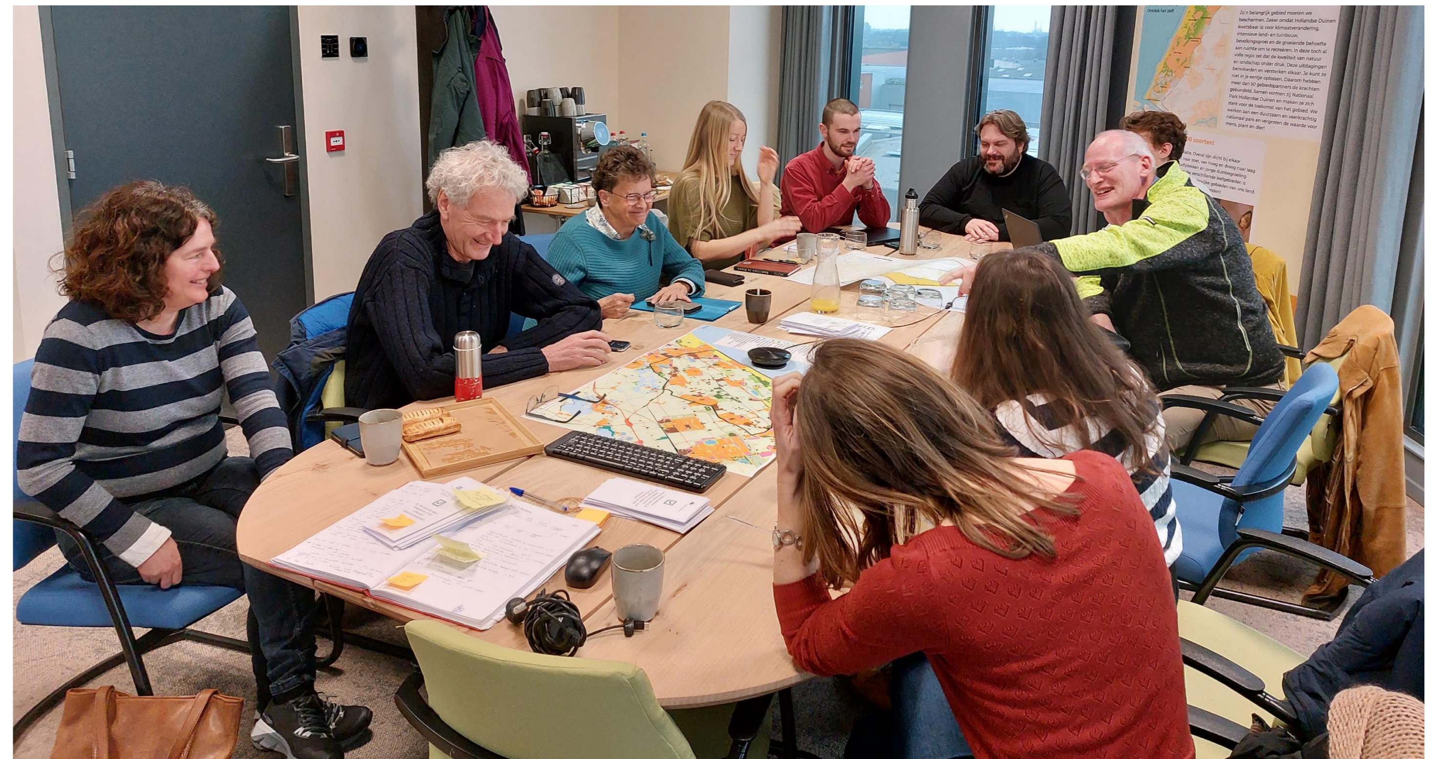
Figuur 2. Workshop setting.