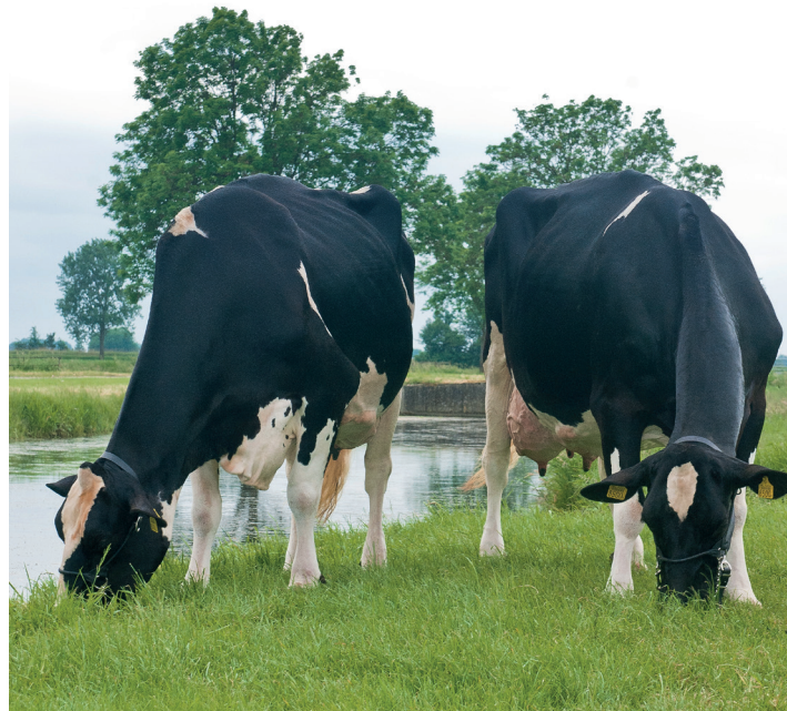
Wilhelmina 358 (v. Juror) en Wilhelmina 369 (v. Allen), 95 en 92 pnt.