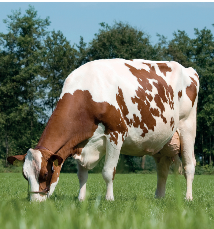
Barendonk Brasileira 12 (v. Classic), 93 punten