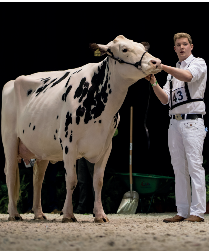
Heitrud (v. Brawler), 92 punten