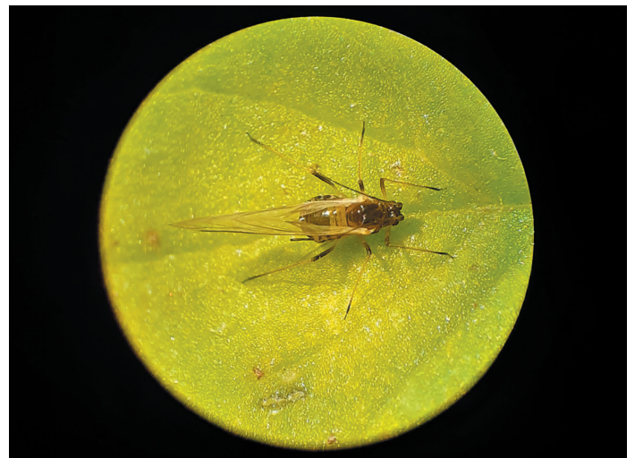
De groene perzickbladluis Myzus persicae .

Vele onkruidwaardplanten zijn bekend voor PVY, op basis van onderzoek zijn deze virusbronnen van weinig belang voor de vroege verspreiding van PVY ( www.crkls.nl ).