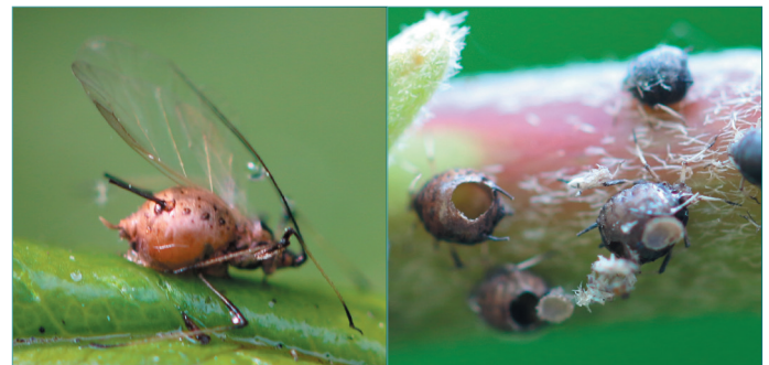
Half mei geparasiteerde gevleugelde en ongevleugelde bladluizen.

Het laten analyseren van extra knollen verschaft meer informatie aangaande PVY-infectie in een partij. Het aantal reacties binnen een partij is een mate van infectiedruk binnen die partij, bij één reactie is extra aandacht nodig in de vorm van ziekzoeken en tijdige inzet van minerale olie in het volgende teeltjaar.