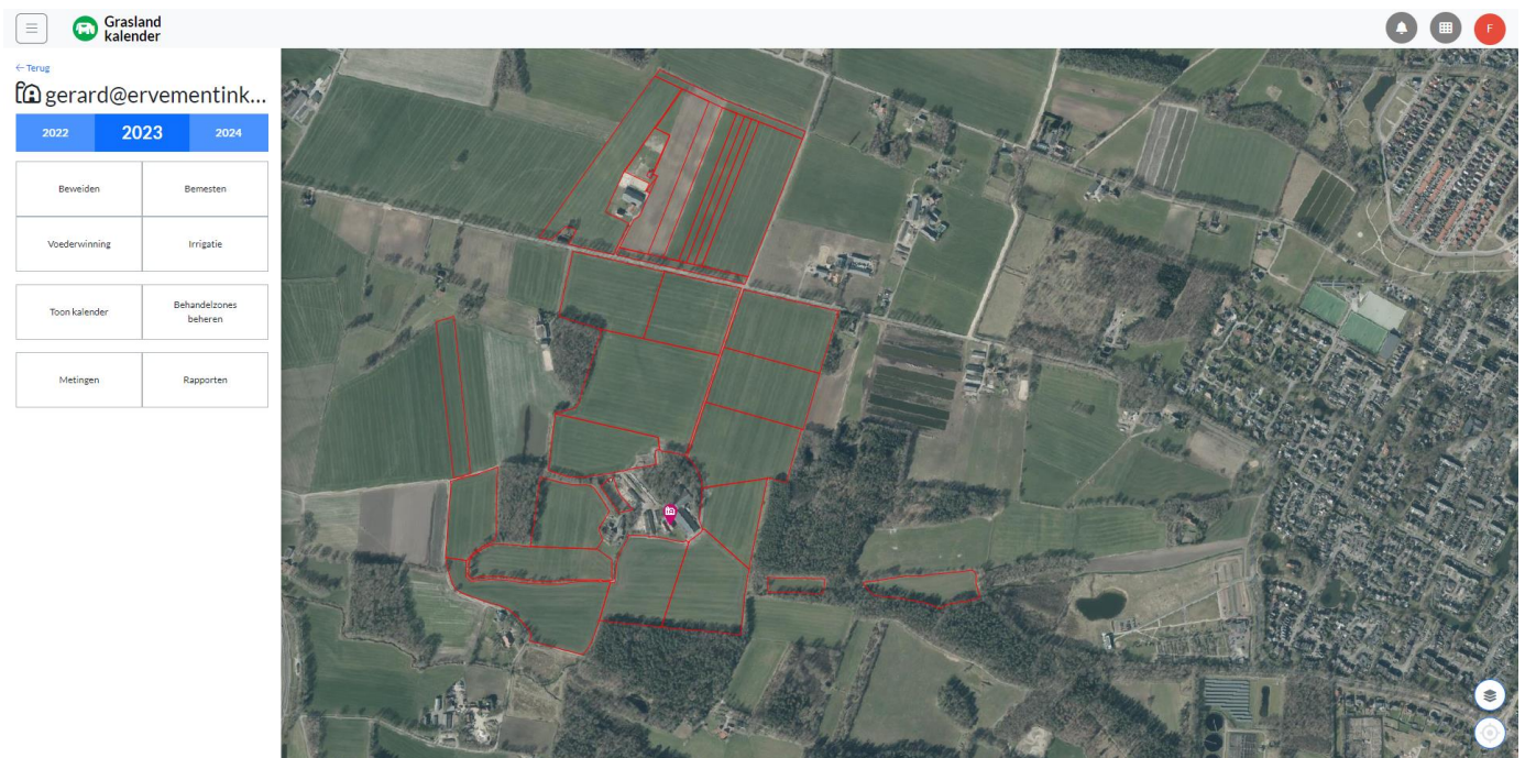
Figuur 1 DGGK-bedrijfsverzicht

creëren en daarmee het gewenste inzicht. Gebruikers van de DGGK kunnen hiermee verschillen in percelen in kaart brengen en daarmee ook de opbrengstverschillen per ha. Daarnaast biedt het mogelijkheden om handelingen op een grasperceel te registreren zoals beweiden, maaien, bloten, oogsten en zomerstalvoeren.