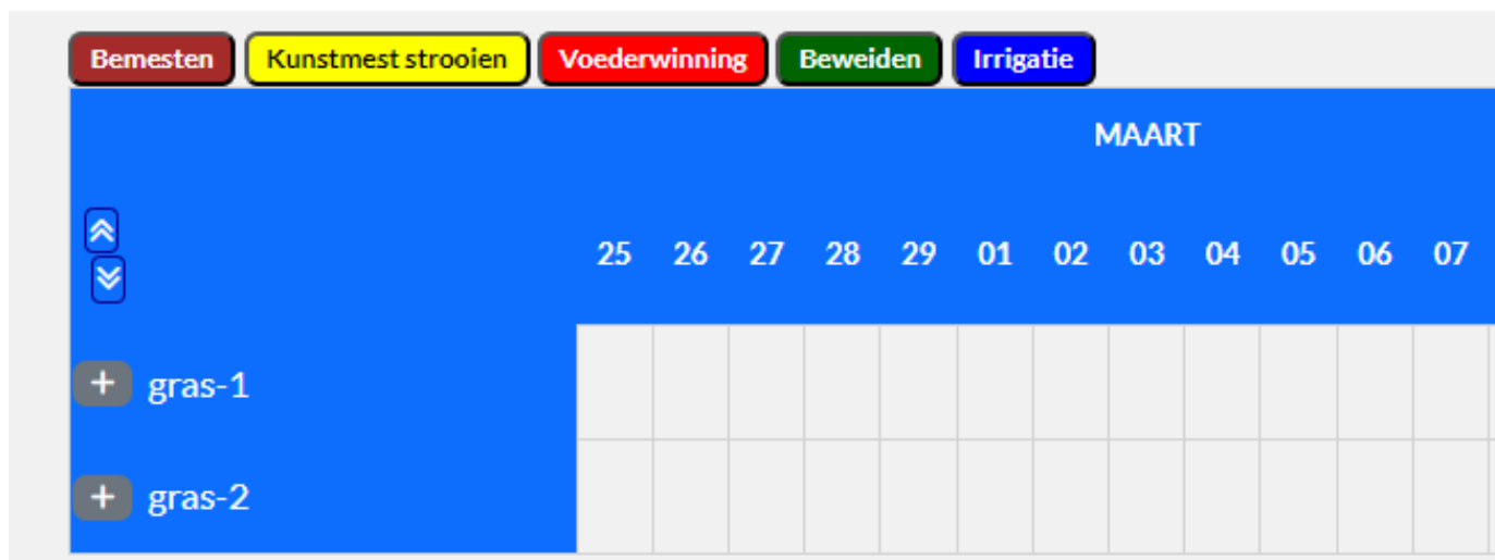
Figuur 3 Detailweergave DGGK-overzicht