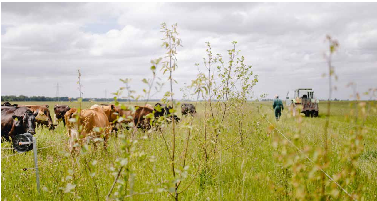
Aangelegde houtwal in het weiland naast het Kuinderbos.