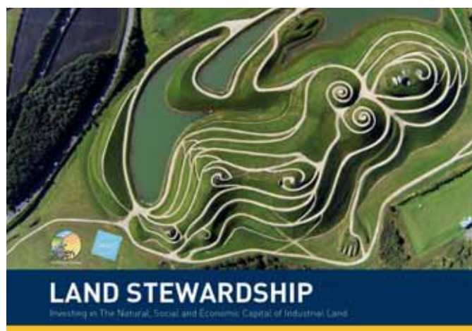
FIGUUR 1: VOORBLAD VAN DE BROCHURE LAND STEWARDSHIP UIT 2018, DE GEZAMENLIJKE VERKENNING VAN COMMON FORUM EN NICOLE

In 2018 schreven we al in Bodem (nummer 2, pagina 12-13) over de gezamenlijke verkenning van het concept Land Stewardship (LS) door de Europese beleidsmakers van het Common Forum en NICOLE. Die verkenning mondde uit in de handzame uitgave "Land Stewardship, Investing in the Natural, Social and Economic Capital of Industrial Land" 1 , waarin de belangrijkste definities en elementen van Land Stewardship zijn toegelicht. Land Stewardship is een begrip of concept, dat zich uitstrekt tot voorbij duurzaam bodembeheer of goed Rentmeesterschap.