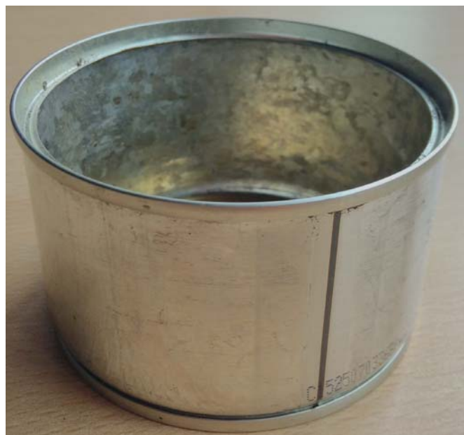
BLIKJE VOOR DE BEPALING VAN HET VOCHTGEHALTE VAN DE BODEM.

terinstrumenten die volumetrische bodemvochtigheid meet over gebieden van ongeveer 10 x 10 km of groter. Hoe meer puntmetingen er worden gedaan des te beter kan de SMAP gevalideerd worden. Het beste moment om de bodemvochtbepaling te doen voor de validatie is als de SMAP satelliet overkomt. Dit moment is te bepalen met een tool op de website.