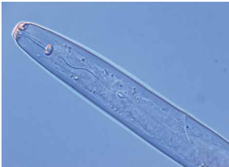
Figuur 2: Plantenetters zoals de Pratylenchus crenatus hebben een stekel waarmee ze in een plantenwortel kunnen prikken.

Helder heeft, samen met collega's, geprobeerd om de maaginhoud van verschillende soorten nematoden te onderzoeken, maar dat viel nog niet mee. Nematoden verzamelen is niet heel lastig: ze zijn relatief gemakkelijk uit de bodem te halen met behulp van een speciale, in Nederland uitgevonden, trechter. Maar de uitdaging begint daarna.