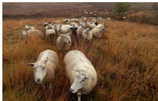
BEGRAZING HEIDEVELD - LAMSVLEES VERKOCHT ONDER HET MERK LANDGOED VILSTEREN.

ken van bovengronds uitrijden, en aan het creëren van stimulansen zoals het gezamenlijk ontwikkelen van ecosystemendiensten.