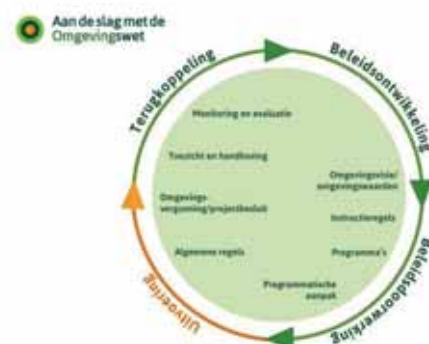
FIGUUR 1: INDELING INSTRUMENTEN OMGEVINGSWET IN DE BELEIDSCYCLUS (BRON: WWW.AANDESLAGMETDEOMGEVINGSWET.NL).