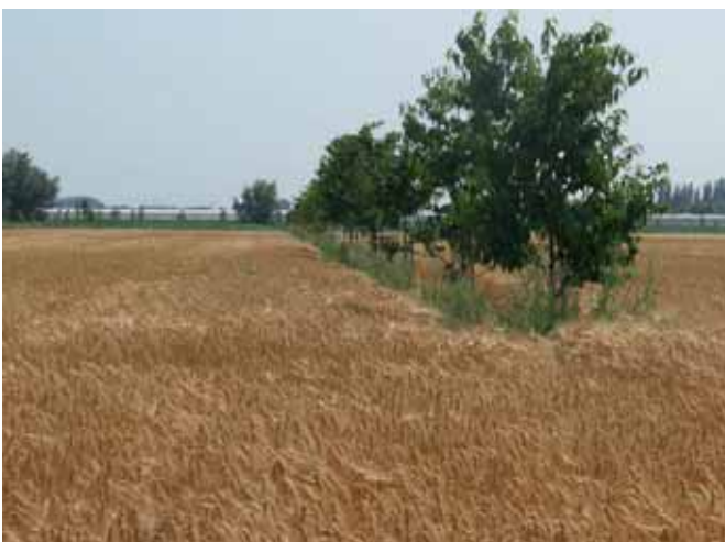
FIGUUR 2: AANLEG VAN DE FOLIEWAND IN DE PROEFOPZET TE IEPER (2014).

Van agroforestry schat men in dat dit teeltsysteem het potentieel heeft om de effecten van droogte te verzachten