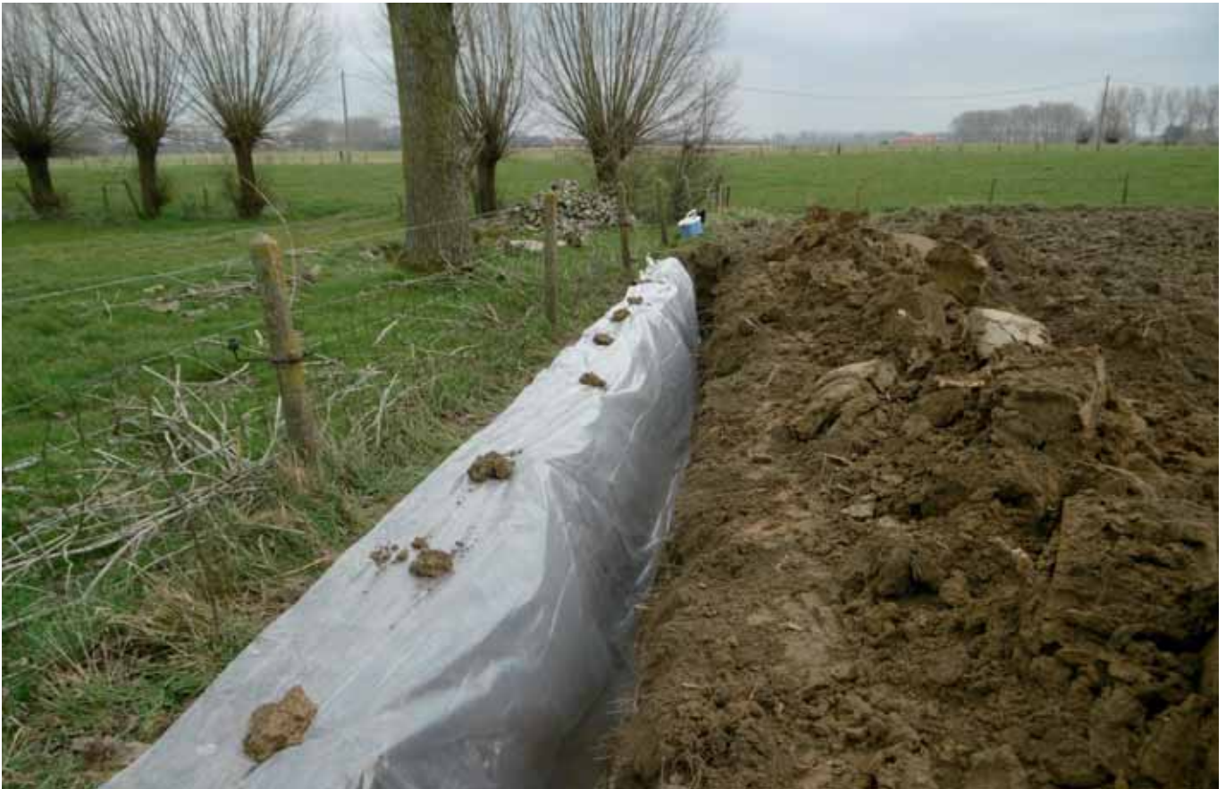
FIGUUR 1: JONGE AGROFORESTRY AANPLANT IN COMBINATIE MET WINTERGRANEN (LOCHRISTI, 2013).