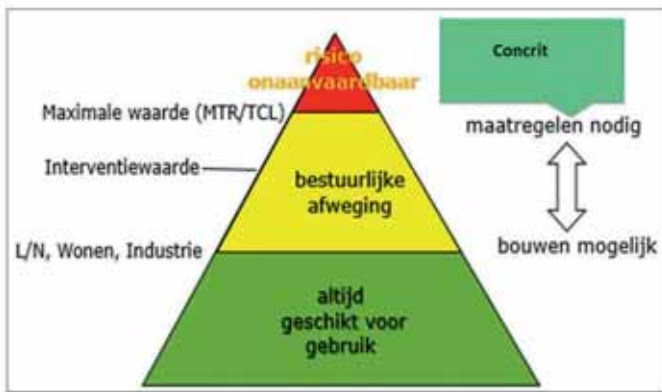
FIGUUR 3: AFWEGINGSRUIMTE GEMEENTEN BIJ BOUWEN OP BODEMGEVOELIGE LOCATIES.

ring. Dit kunnen rechtstreeks werkende regels zijn of instructieregels aan gemeenten. Via deze decentrale regels kan een initiatiefnemer verplicht worden om bij een voorgenomen ontwikkeling of activiteit aanvullende maatregelen te nemen ter verbetering van de grondwaterkwaliteit. Daarbij kun je denken aan een verplichte bronaanpak of het uitvoeren van een grond-