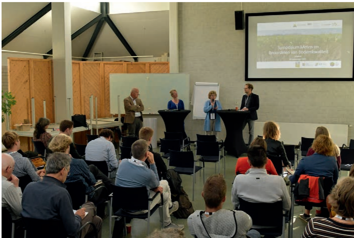
FOTO-IMPRESSIE SYMPOSIUM METEN EN BEOORDELEN BODEMKWALITEIT.

rol (Figuur 1). Bodemfuncties geven kwantitatief inzicht in de bijdrage van een bodem aan een dienst, zoals het water leverend vermogen, indringingsweerstand van wortels, ziekteweerbaarheid, en nutriëntenbeschikbaarheid, en worden afgeleid van één of meerdere bodemkenmerken. Om te bepalen in hoeverre bodemfuncties behaald worden, worden per functie zogenoemde streefwaarden gebruikt. De streefwaarde kan bijvoorbeeld aangeven of er sprake is van een overmaat of een tekort. Streefwaarden worden afgeleid vanuit empirisch of modelmatig onderzoek (denk aan de resultaten van 50 jaar veldonderzoek die gebruikt zijn voor de bemestingsadviezen), als ook expertkennis en statistische technieken (bijvoorbeeld het relatieve risico op uit- en afspoeling op basis van perceelskenmerken). Een bodemkenmerk zonder een onderbouwde koppeling met een “streefwaarde” voor een bodemfunctie geeft dus weinig informatie over de bodemgezondheid. Referentiewaarden geven aan wat de meest voorkomende waarde is voor een bodemkenmerk, maar zijn niet geschikt om de kwaliteit van een bodem te beoordelen.