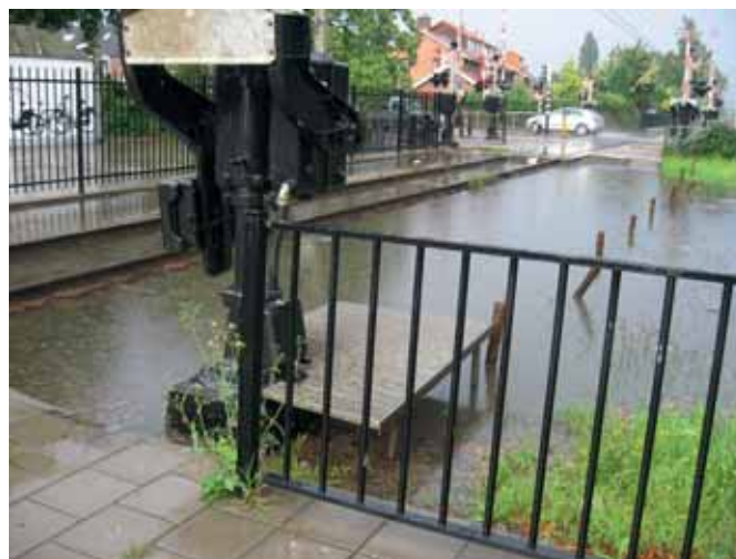
FIGUUR 1: WATEROVERLAST IN DE STAD NA REGENVAL.

me van de agrarische productiecapaciteit en het watervasthoudend vermogen van de bodem en uiteindelijk zelfs tot erosie en verwoestijning, maar ook tot uitspoeling van nutriënten en verontreinigingen naar het grondwater (figuur 2). Om aan de waterbehoefte van gewassen te voldoen kan beregening met grond- en/of oppervlaktewater nodig worden. Dit kan natuur(ontwikkeling) en andere functies zoals drinkwatervoorziening verstoren en kan leiden tot extra gebruik van kunstmest en bestrijdingsmiddelen.