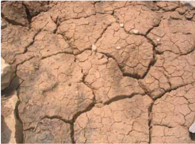
FIGUUR 2: VERLIES ORGANISCHE STOF KAN LEIDEN TOT EROSIE EN VERWOESTIJNING.