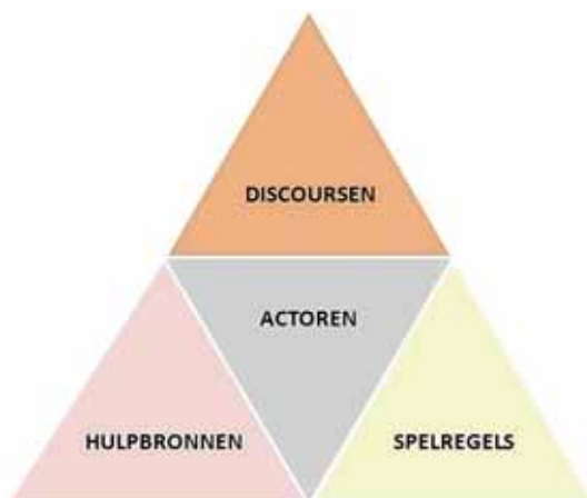
FIGUUR 2: DE DIMENSIES VAN EEN BELEIDSARRANGEMENT, ALLEN MET ELKAAR VERWEVEN.

Onderstaande figuur geeft weer dat de vier dimensies sterk met elkaar verweven zijn. Veranderingen in een dimensie leiden tot aanpassingen in de anderen dimensies. Zo zal een veranderend discours ook leiden tot veranderingen in de andere dimensies.