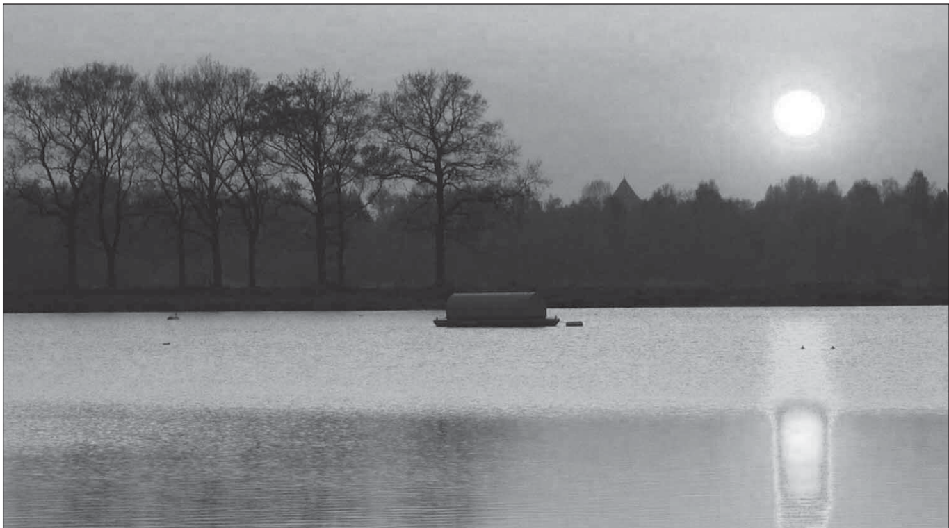
FOTO 2: DIEPE Plassen HEBBEN VOOR VELEN BIJZONDERE WAARDEN.

kelingen in regionale plannen (inspraak) en op het moment van de uitwerking van lokale initiatieven in een inrichtingsplan (afstemming).