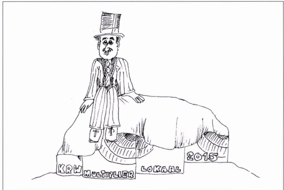
BESEFT HET BESTUUR VAN BEVOEGDE OVERHEDEN DE VELE OPDRACHTEN AAN BODEMSANERING?

De laatste jaren wordt de uitvoerende ambtenaar geconfronteerd met meerdere beleidsdoelen. De nationale bodemsaneringsoperatie en de Europese kaderrichtlijn Water stellen beide doelen aan bodemsanering, met overigens ieder een eigen prioriteitsvolgorde. Daarnaast kent de eigen organisatie prioriteiten die voortkomen uit de ruimtelijke ontwikkelingsbehoefte of uit de signalen van de lokale samenleving. Tenslotte wordt de decentrale overheid gevraagd om een financiële multiplier te realiseren, waarbij bodemsanering grotendeels vanuit de markt kan worden gefinancierd (en geïnitieerd). Binnen al deze opdrachten is het voor