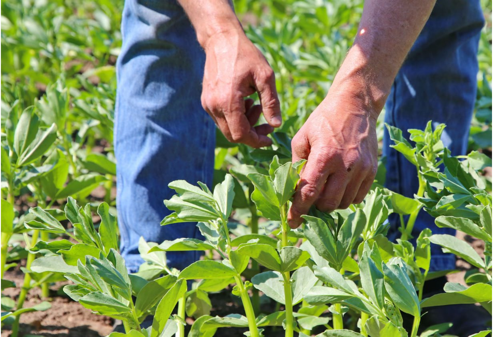
Figuur 2. Eiwitrijke veldbonen vergroten het aandeel eigen eiwitteelt.

In 2022 bestond het rantsoen van een Koeien & Kansen-bedrijf gemiddeld uit 64% eiwit dat op het eigen bedrijf, of binnen een straal van 20 km van het bedrijf is geproduceerd. Hierbij werd de doelstelling van 65% net niet gehaald. Het percentage gevoerd eiwit uit eigen omgeving werd in 2022 niet negatief beïnvloed door de lagere grasopbrengst omdat de bedrijven nog genoeg voorraad graskuil hadden.