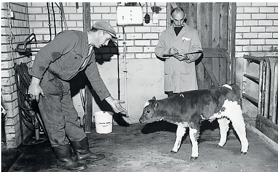
Veehouders maakten graag tijd voor een praatje met de kalverschetser

De voormalig controleur stamboekhouder herinnert zich nog dat een schets voor de veeverbetering geen officiële status had. Daarvoor moest de afstamming nog worden geverifieerd en bevestigd met een zogenaamde 'zwarte kaart' door het NRS in Den Haag. Koeien konden zonder zwarte kaart bijvoorbeeld nooit stiermoeder worden. Ook de geboorte van de eerste kalfjes met