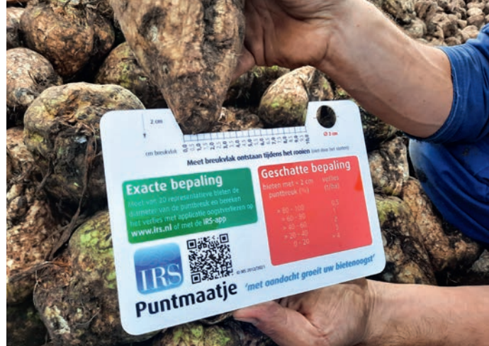
Voor het bepalen van de rooikwaliteit is het punt- en kopmaatje een handig hulpmiddel

De afgelopen jaren heeft de agrarische dienst van Cosun Beet Company regelmatig rooichecks uitgevoerd bij diverse telers en loonwerkers door het hele land. Hier zijn enkele interessante inzichten uit voortgekomen.