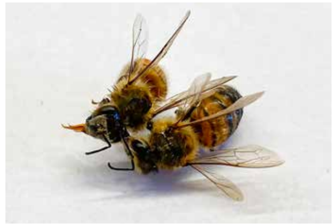
Bijen met vleugels in K-stand.

van eind 2022 correleerde hoog-significant met de gerapporteerde sterfte begin 2023. Volken met een relatief geringe besmettingsgraad (minder dan een miljoen virusdeeltjes per bij) overleefden voor 96 %. Volken met zeer sterke infecties (meer dan 90 miljard virusdeeltjes per bij) overleefden voor 56%. Ter vergelijking, bij de nationale wintersterfte enquête vertegenwoordigden imkers die geen of slechts in geringe mate DWV hadden waargenomen tezamen 17015 bijenvolken, waarvan in totaal 74% overleefde. Echter, onder de volken van imkers met ernstige DWV symptomen was er 46% overleving.