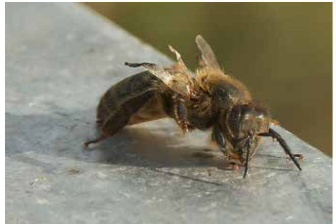
Bij met DWV.

Komen infecties met CBPV virus tegenwoordig vaker voor? Op dit kaartje worden per regio "ja" versus "nee" resultaten geïllustreerd. Een toename van CBPV- infecties wordt voornamelijk door imkers het zuiden van ons land emeld (82% "ja").