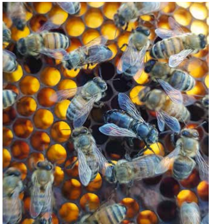
Een haarloze bij met zwart opgeblazen achterlijf is een symptoom van CBPV-infectie.

In April 2023 bleek 21% van de 301 bemonsterde volken