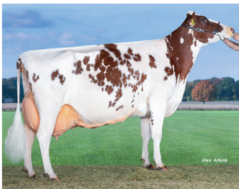
Irma 68 (v. Curtis), kampioene oudere koeien Levensprod.: 3477 111.045 3,93 3,42

fraaie mix tussen melktype en kracht en veel breedte in de fraai beaderde uier. Ook de fraai gelijnde stalgenotes P.M. Rebekka 173 (v. Avatar) en P.M. Rosy 5 (v. Unstopabull) van familie Pinkert uit Markelo schaarden zich met hun lange frames en ondiepe uiers moeiteloos bij het finale zestal.