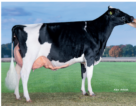
Topcross Janice 1 (v. Charityman), kamp. oud. Levensprod.: 1471 55.635 4,08 3,47