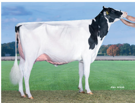
Drouner Cosmo 1836 (v. Alligator), kamp. jong. Prod.: 2.00 94 3.228 3,72 2,98 lw 104 I.I.