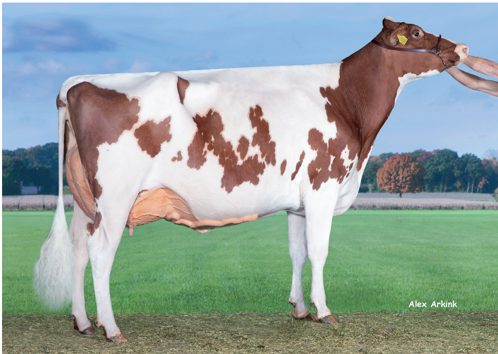
Twente Dairies Incredibull Mel (v. Incredibull), alg. kamp. Prod.: 3.04 396 14.381 4,04 3,19 lw 111