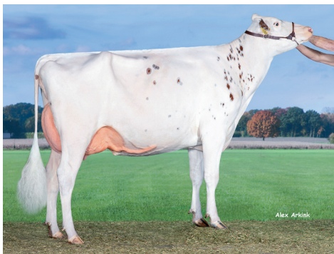
Noorder Splash P Vrc (v. Mirand), kamp. vaarzen Prod.: 2.00 257 7.862 3,97 3,09 lw 90 l.l.