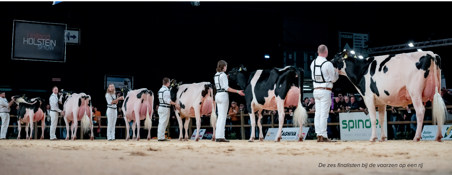
De zes finalisten bij de vaarzen op een rij