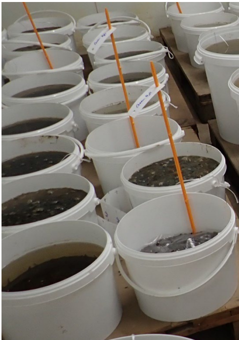
Figuur 3 Emmer-proef inundatie, Lelystad 2021

De proef is uitgevoerd met drie grondsoorten; een (duin) zandgrond, een zavelgrond met een percentage afslibbaar van 27% en een zavelgrond met percentage afslibbaar van 33% (zie tabel 1). De zandgrond, afkomstig van een perceel te Alkmaar, had een pH van 7,2, een organisch stofgehalte van 3% en een percentage afslibbaar van 3%. Beide zavelgronden zijn verzameld van percelen van WUR | OT te Lelystad. De lichtste zavelgrond had een pH van 7,6 en een organisch stofgehalte van 2,4%. De wat zwaardere zavelgrond een pH van 7,4 en een organisch stofgehalte van 3,4%. Deze grond is minder zwaar dan werd aangenomen. Op basis van resultaten van een al beschikbare bodemanalyse is dit perceel geselecteerd. De plek waar de grond is verzameld, is duidelijk lichter dan op basis van de analyse (circa 40% afslibbaar) werd verwacht.