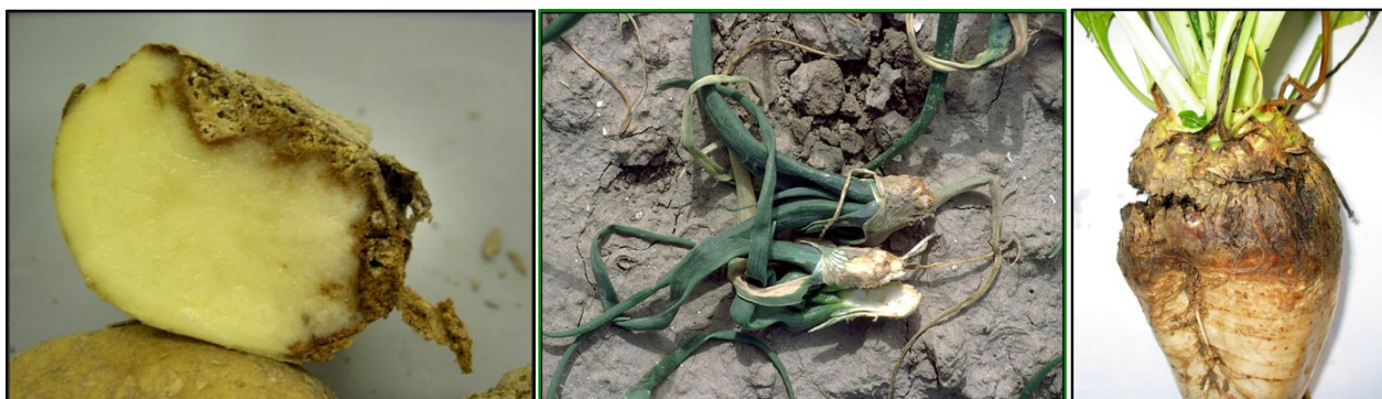
Figuur 1 Schade door stengelaaltjes in aardappel, uien en suikerbiet

Bestrijding wordt hiermee voorlopig de belangrijkste maatregel in de beheersingsstrategie van stengelaaltjes. Bestrijding door chemische grondontsmetting of door granulaten is niet meer mogelijk omdat er geen middelen meer beschikbaar zijn. Ook bleek deze techniek in het verleden niet afdoende te werken.