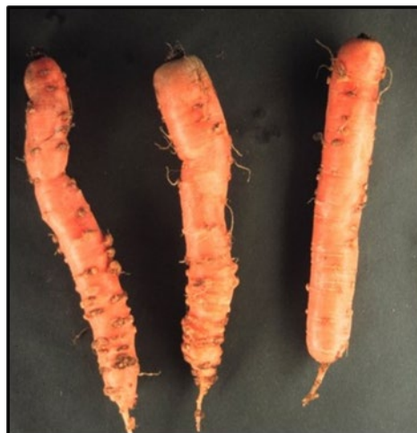
Foto 1 en 2. Aantasting van M. chitwoodi in aardappel en peen. M. fallax veroorzaakt vergelijkbare symptomen in aardappel en peen en is niet van een M. chitwoodi aantasting te onderscheiden

Een belangrijk instrument voor de beheersing van plant parasitaire aaltjessoorten is een goed doordachte vruchtwisseling met niet-waardplanten of resistente cultuurgewassen en de juiste groenbemesterkeuze. De beheersing van M. chitwoodi en M. fallax door gewasrotatie is echter lastig omdat veel cultuurgewassen waard zijn voor deze aaltjessoorten.