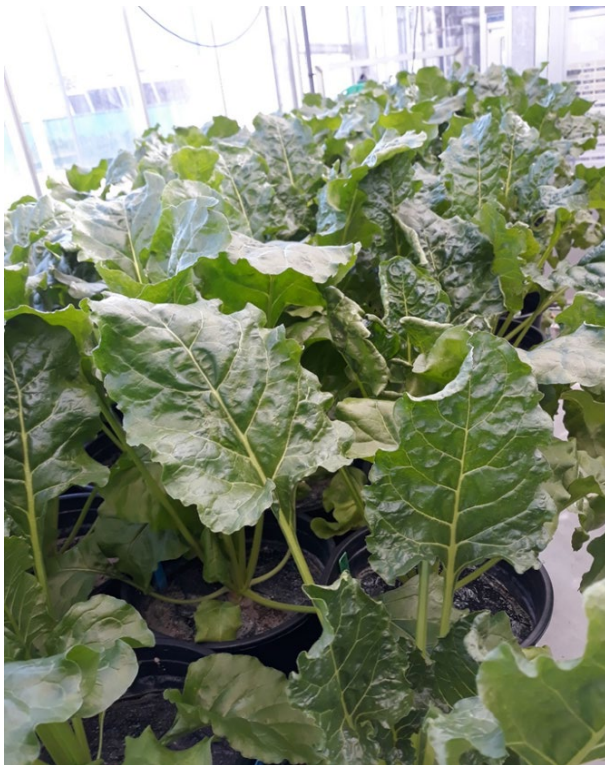
Foto 3. Overzicht kasproef resistentietoetsing M. fallax , 2022